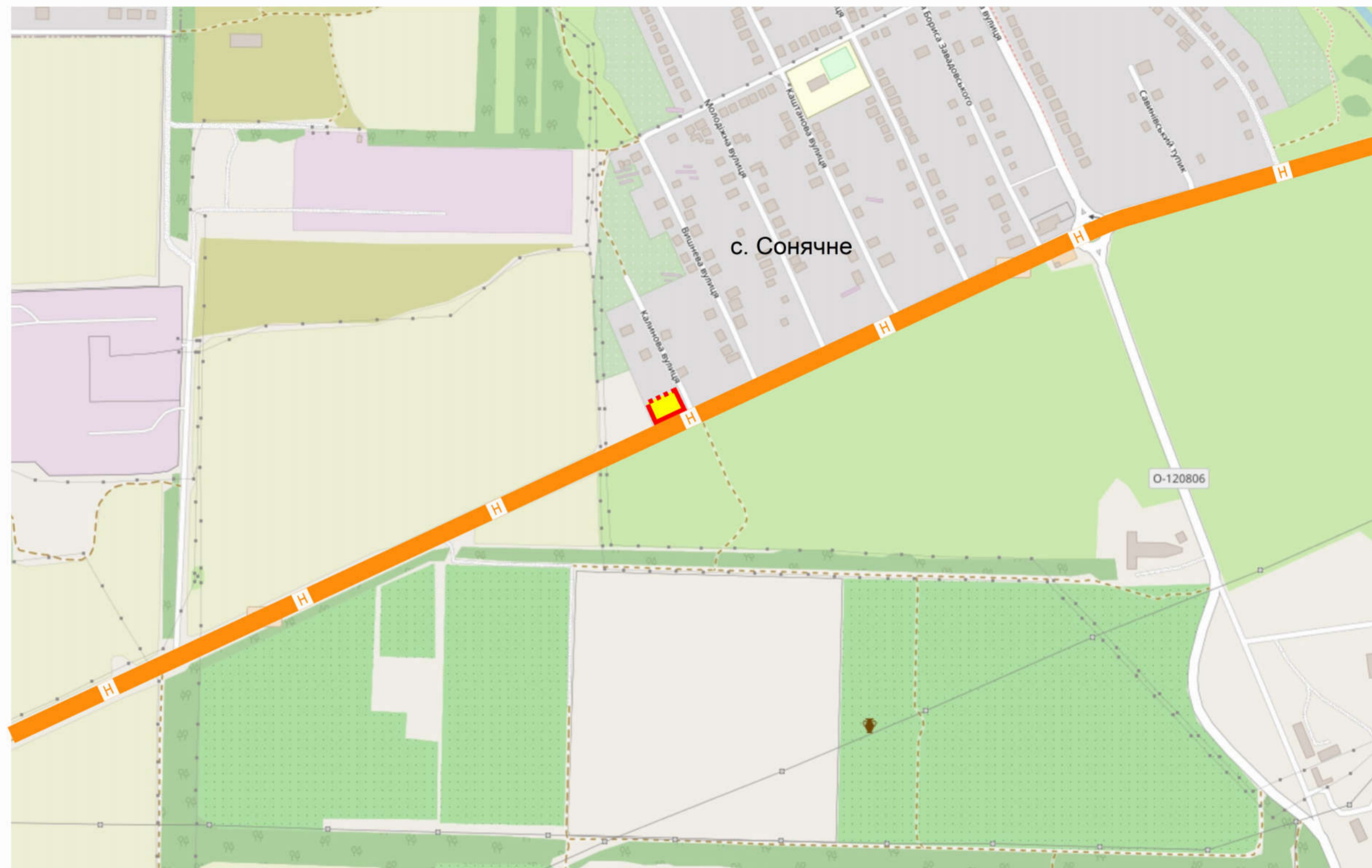
СХЕМА РОЗТАШУВАННЯ ТЕРИТОРІЇ ДЕТАЛЬНОГО ПЛАНУ ТЕРИТОРІЇ В СИСТЕМІ ПЛАНУВАЛЬНОЇ СТРУКТУРИ НАСЕЛЕНОГО ПУНКТУ

на земельні ділянки, які перебувають в комунальній власності орієнтовною площею 0,14 га із земель громадської забудови – на категорію земель житлової забудови – для будівництва і обслуговування житлового будинку, господарських будівель і споруд (присадибна ділянка) (код КВЦПЗД-02.01) на території Первозванівської сільської ради Кропивницького району Кіровоградської області