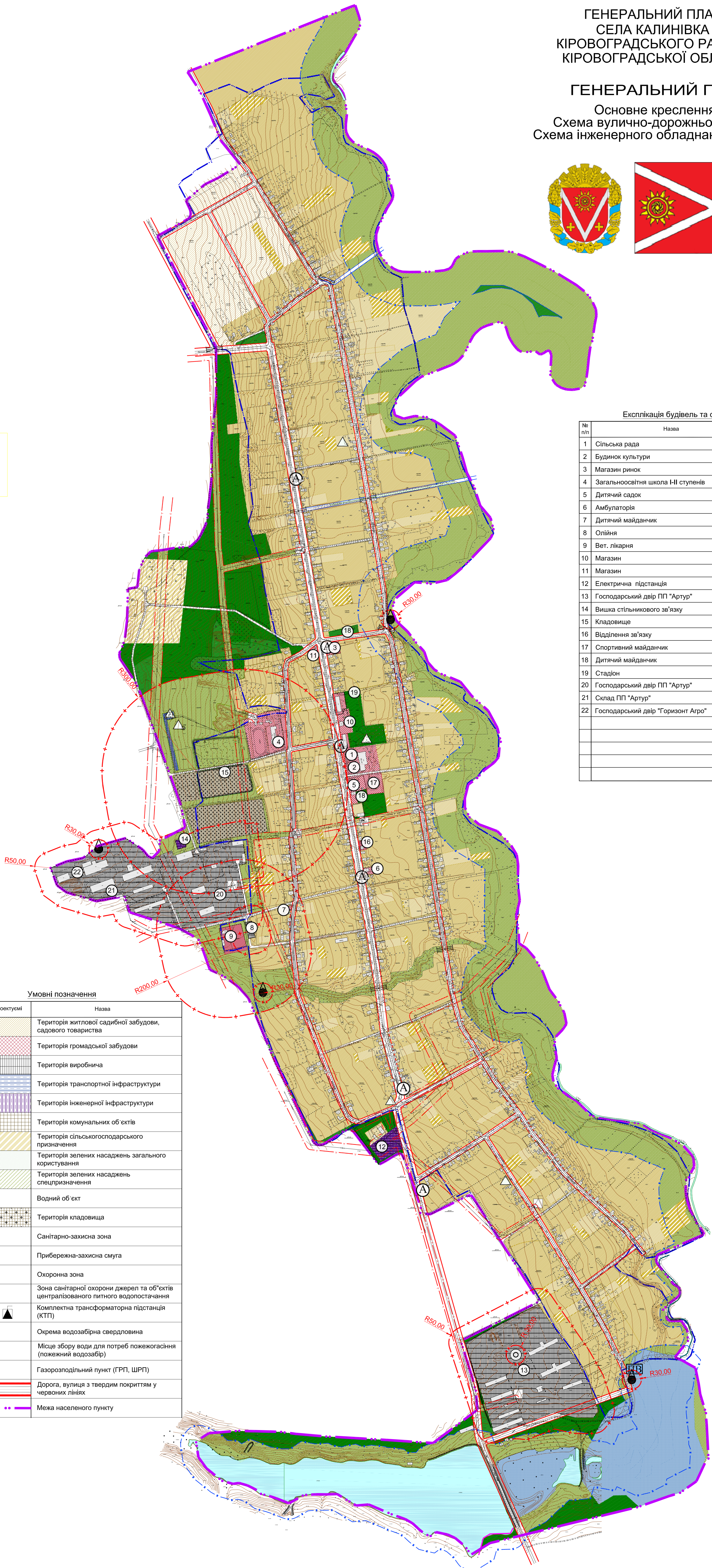
Експлікація будівель та споруд